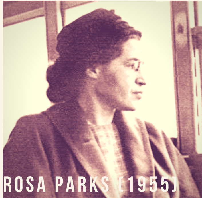
ROSA PARKS [1955]